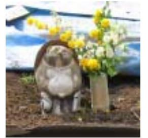
炭窯の守り神・タヌキさん