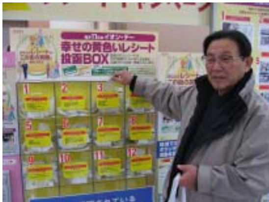
黄色いレシート投函（毎月11日のみ設置） 3番BOXがNPOじおすのポストです

会員みなさんには既にお知らせしましたが狭山サティでは4月から地域貢献事業として「幸せの黄色いレシートキャンペーン」を始めました。毎月11日に狭山サティで買物すると黄色いレシートがもらえます。それを応援したい団体に投函すると、投函されたレシートの総額の1%に相当する品物が当該団体に寄贈されるというもの。NPOじおすも団体登録しており、6月末現在のレシート総額は約911千円にも及びます。応援していただいた皆様に感謝いたします。このキャンペーンはまだしばらく続きます。ぜひご協力を。